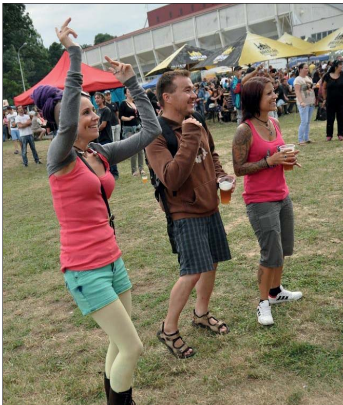
Festival piva a vína byl o zábavě, tanci a pohodě.