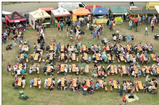
Moravské dny si ze zámeké věže prohlédly stovky lidí. Vstup byl zdarma.