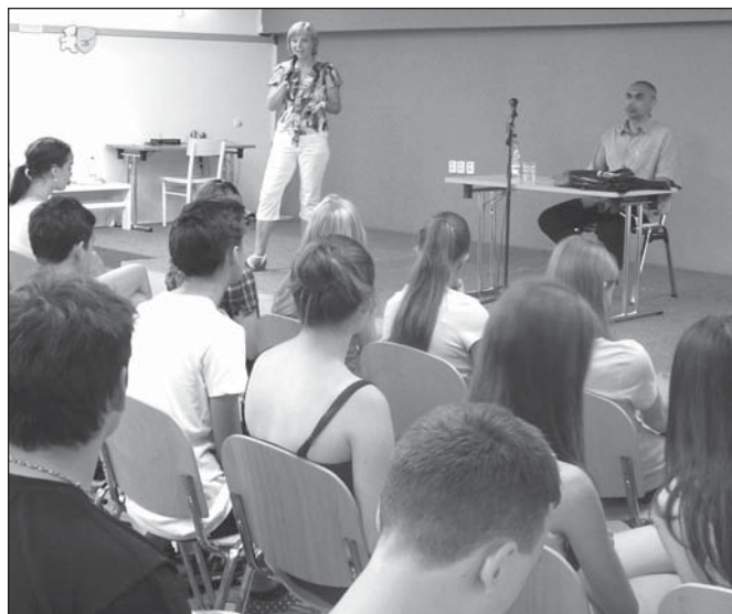
Starosta Břeclavi Pavel Dominik odpovídal v knihovně školákům na všetečné dotazy v rámci tradiční besedy Starostí pana starosty.

I když v teplejších měsících roku bývá zájem o počítačové kurzy menší, zkusíme letos na základě přání několika zájemců uspořádat kurz Seznámení s počítačem pro úplně začátečníky i o prázdninách. Kurz začne v pondělí 3. srpna v 9 hodin. Bude mít čtyři lekce, které budou probíhat tentokrát každé pondělí a středu od 9 do 11 hodin v malém sále knihovny. Zájemci