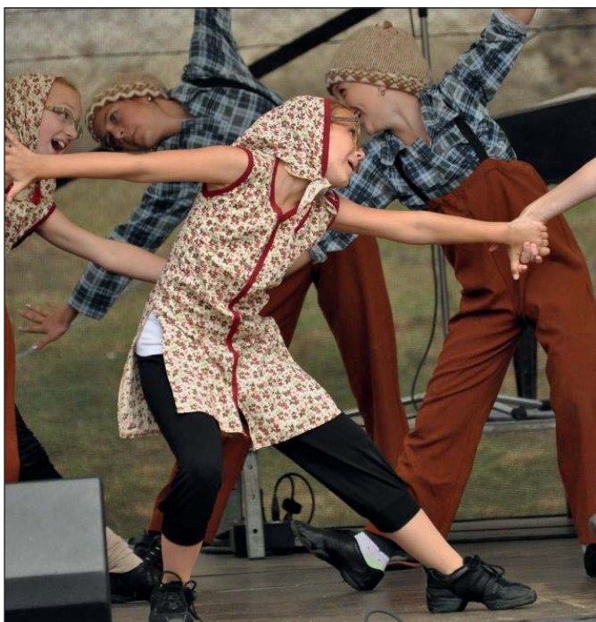
Břeclavské taneční skupiny rozproudily mnohým krev v žilách.